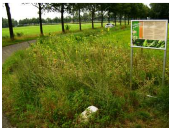
Akkerrand met informatiepaneel.

Het akkerrandenproject 2014 is een voortzetting van een project dat al enkele jaren loopt en is gestart door de Gebiedscommissie Aalten. Langs agrarische percelen, overhoekjes en wegbermen wordt een bloemrijk kruidenmengsel ingezaaid. Deze randen dragen bij aan een visueel aantrekkelijker landschap en versterken de ecologische kwaliteit vanwege de toename aan nectarplanten (o.a. goed voor bijen). Er wordt jaarlijks een fietstocht georganiseerd door de VVV-Aalten langs de bloeiende akkerranden. Verschil met het Patrijzenproject is dat deze akkerranden ook buiten het verspreidingsgebied van de Patrijzen worden aangelegd en op plekken die niet bijzonder geschikt (winter)habitat voor Patrijzen zijn zoals wegbermen.