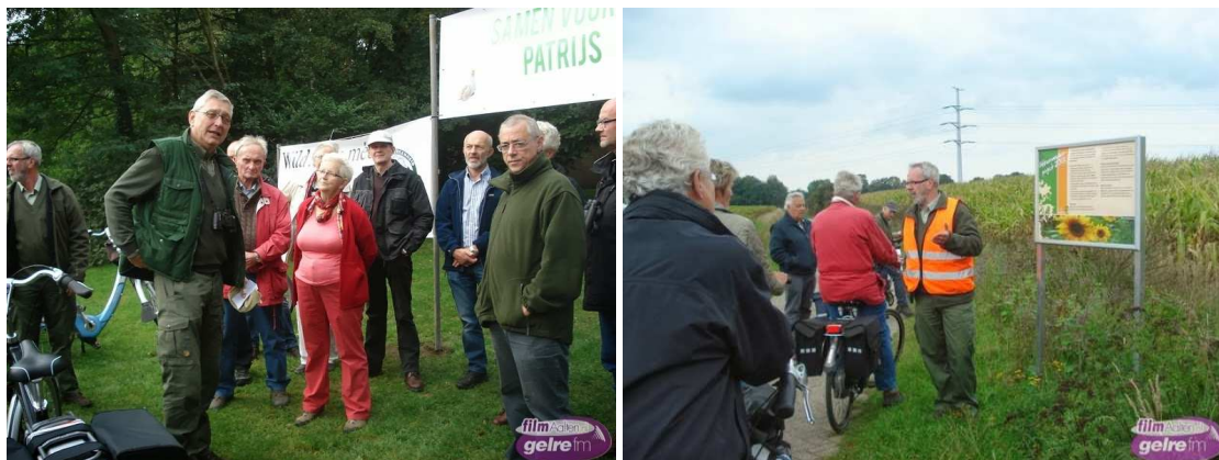
Voorlichting aan geïnteresseerden over het Patrijzenproject tijdens een van de fietstochten.

Met de gevraagde bijdrage wordt zaaigoed aangeschaft en krijgen deelnemers een kleine vergoeding voor het niet in gebruik nemen van agrarische stukken land.