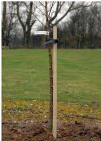
Voorbeeld van een hoogstam fruitboom met boompaal.

Er wordt een bijdrage gevraagd voor de aanschaf van boompalen die gebruikt worden bij uitvoering van het gemeentelijke landschapsproject. Deze boompalen worden beschikbaar gesteld aan de uitvoerende partijen. Omdat de PAN het gros van de aanplant van solitaire bomen voor haar rekening neemt, heeft de PAN het initiatief genomen om deze bijdrage aan te vragen. Er worden milieuvriendelijke boompalen gekocht van onbehandeld kastanjehout.