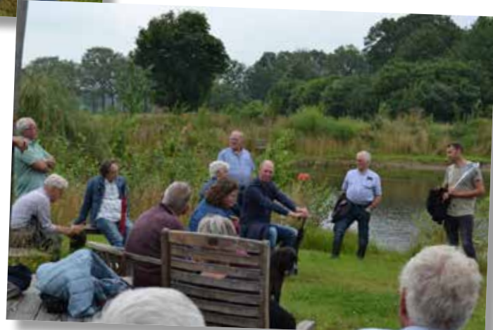
Foto's van de opening van het akkerrandenproject op woensdag 14 juli 2021