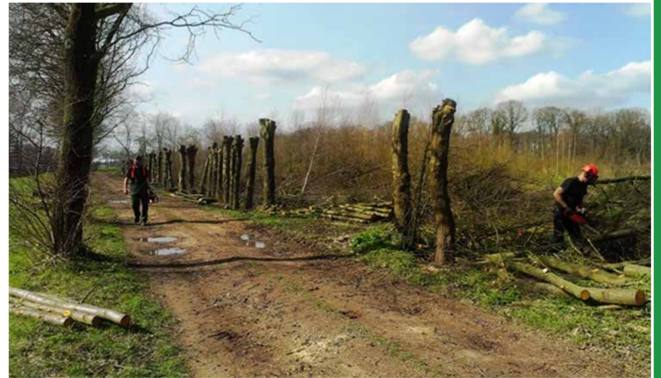
Vrijwilligers van StivLA knotten elzen aan de Pakkenbierweg. Maart 2015.

Het budget is ingezet voor de oprichtingskosten van de stichting, het maken van een internetsite en het aanschaffen van gereedschap voor landschapsbeheer.