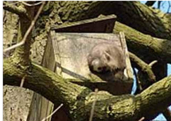
Steenmarter verlaat Steenuilenkast.