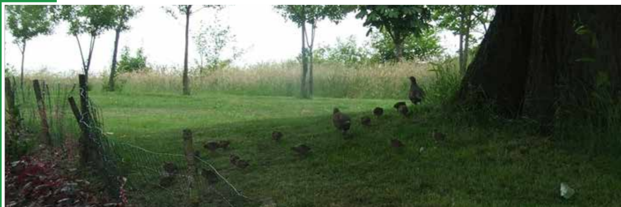
Patrijs; doelsoort van het project.