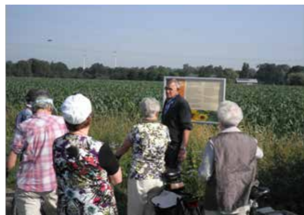
Fietstocht en excursie langs de akkerranden.