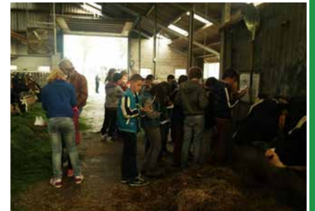
Deelnemers van het project 'LTO scholenproject' op bezoek bij melkvee- en ijsboerderij Lensink.