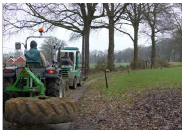
Er komt nogal wat kijken bij het ophangen van een kast...

Door nestcontroles kwam aan het licht dat de nestkasten in toenemende mate gepreëdeerd werden door steenmarters die daarbij de oude vogels en/of de jongen opat. In eigen beheer en proefondervindelijk is een nestkast ontwikkeld waar de uilen wel in kunnen, maar de steenmarter niet. Predatie hoort natuurlijk tot de normale gang van zaken, maar nestelende Steenuilen onder het dak van een schuur hebben nog kans te vluchten. Een uilenkast met één ingang biedt die mogelijkheid niet.