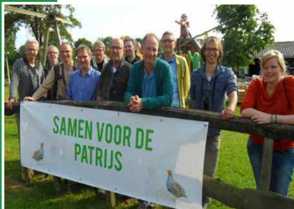
Patrijs; doelsoort van het project.