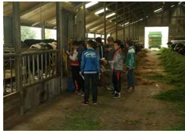
Leerlingen bij melkvee- en ijsboerderij Lensink.