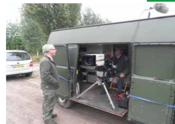
Televisieopnames door CINATUUR-producties.

Dit leidt soms tot fraaie reacties zoals een ingestuurde foto van een paartje Patrijzen met jongen in de tuin van een bewoner van Barlo. Het actief betrekken van bewoners zorgt voor vergroting van het draagvlak voor project.