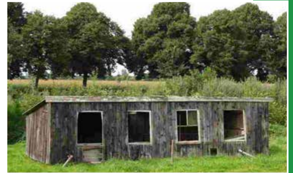
Vervallen kippenhok; nestplaats voor Steenuilen. Deze schuur is inmiddels ook gesloopt.

De Vogelwerkgroep is daarom vanaf begin jaren '90 begonnen met het plaatsen van nestkasten als alternatieve nestplaats voor de uilen.