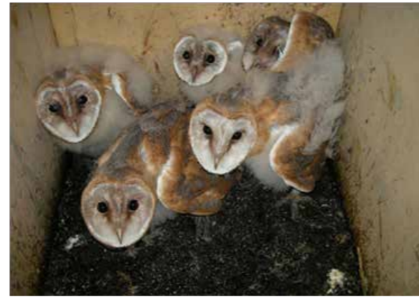
Kerkuilenkast in schuur (links) en een kast met vijf jonge Kerkuilen.